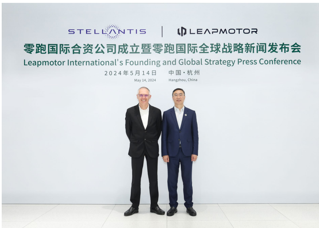
Da sinistra: Carlos Tavares, CEO di Stellantis, e Jiangming Zhu, fondatore, Presidente e CEO di Leapmotor

commerciale di Stellantis sui mercati internazionali per aumentare le vendite del brand Leapmotor in altre regioni.